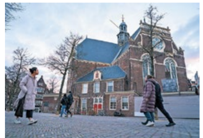
In de jaren tachtig besloot de centrale kerkenraad dat twintig kerkgebouwen in de stad moesten sluiten, waaronder de Noorderkerk.

Aan het eind van de kringavond praat ik na met een deelnemer, die na een Veluwe jeugd 'decennialang' niet in de kerk is geweest. 'Toen vond God het genoeg.' Het uiterlijk van de zestiger, met zijn witgrijze paardenstaartje, spoort niet meteen met zijn bevindelijke taal. 'God maakte me duidelijk dat de oorzaak van mijn aversie niet in de kerk, maar in mezelf zat. Hij "ontdekte me aan mijn zonde" – ik hou van die term, want het is genade.' Sindsdien slaat hij geen zondag over. 'Wat dacht je? Ik heb honger en dorst!' Zo'n kring is 'typisch de Noorder', zegt Visser als we later in een nabijgelegen kroeg de avond aflussen. 'Schuif aan en doe maar mee, dat zit in de genen van deze gemeente. Maar ook: geef onbekommerd getuigenis over God. Wees maar helder. Wie is God, wat betekent het geloof? Recht voor z'n raap, ja. Spannend, maar ook: levendig.' ◀