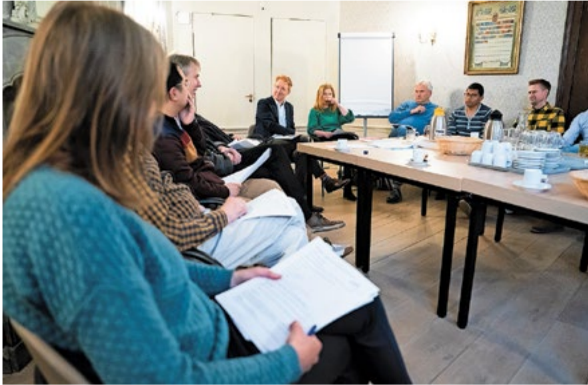
Tijdens de gesprekskring buigen achttien deelnemers zich over een tekst van Kierkegaard.