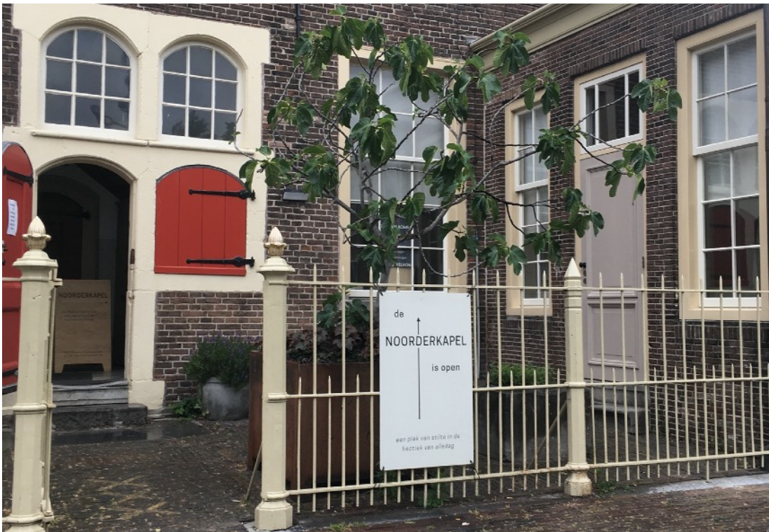
De bloeiende vijgenboom voor de Noorderkapel