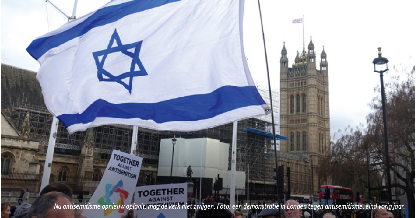
Nu antisemitisme opnieuw oplaat, mag de kerk niet zwijgen. Foto: een demonstratie in Londen tegen antisemitisme, eind vorig jaar.